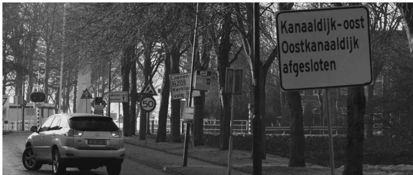
Eerder dan verwacht zijn de opknop werkzaamheden aan Kanaaldijk Oost gereed. Voor de Kerst kan er weer gewoon richting Utrecht gereden worden. De gele vervuiling is intussen uit onze omgeving verdwenen.