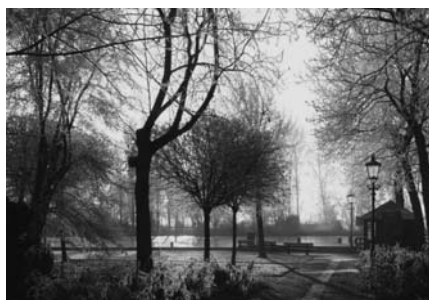
Het Ameszpark in volle gloren

Op initiatief van Truus Brouwer en Joke Baks werd fotograferend Nigtevecht op pad gestuurd om ons dorp in winterse omstandigheden op de gevoelige plaat vast te leggen. De weersomstandigheden waren ons voor dit doel gunstig gezind. De resultaten werden door onze beroemdste dorpsfotograaf Edwin Smulders beoordeeld. Op 10 maart kwamen alle fotografen in het Dorpshuis bijeen en werden elkaars resultaten bewonderd. Het leverde drie prijzen en een eervolle vermelding op.