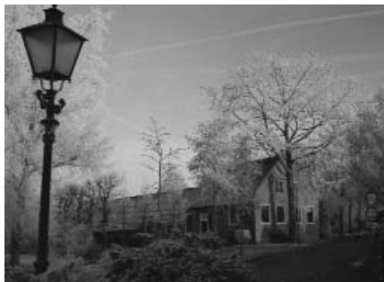
Eerste zonnetje van de dag