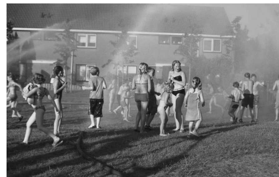
Verdwijnen dit soort tafereel straks door nieuwe regelgevingen?

Directe aanleiding is de zogeheten Arhi-procedure die de provincie is gestart om te komen tot een gemeentelijke herindeling. De gemeente Loenen heeft zich jarenlang tegen de herindeling verzet. Toch lijkt het proces dat in gang is gezet onherroepelijk door te gaan. Eind deze maand wordt de knoop in Den Haag doorgehakt, zodat per 1-1-2010 de samenvoeging formeel kan ingaan. Op de valreep zijn er nog twee scenario's mogelijk, de vier beoogde gemeenten (Breukelen, Loenen, Ronde Venen en Abcoude) en het alternatief, de twee gemeenten Loenen en Breukelen onder één vlag. Voor beide veranderingen geldt dat de afstand tot het gemeentebestuur niet alleen in kilometers veel groter zal worden, ook de relatie zal afstandelijker en zakelijker worden. Om te voorkomen dat onze prachtige natuur straks vol staat met nieuwbouw, er geen bus meer rijdt en voetballen alleen nog in Weesp kan, moeten we onze toekomst verzekeren. De Dorpsraad wil dat het huidige bestuur van de gemeente Loenen een handtekening zet onder een "Dorpsvisie Nigtevecht". Een visie die als belangrijkste doel "niet slapen, maar leven" heeft. Een dorpsvisie kan een middel zijn om alvast te omschrijven en te borgen wat belangrijk gevonden wordt voor en door het dorp