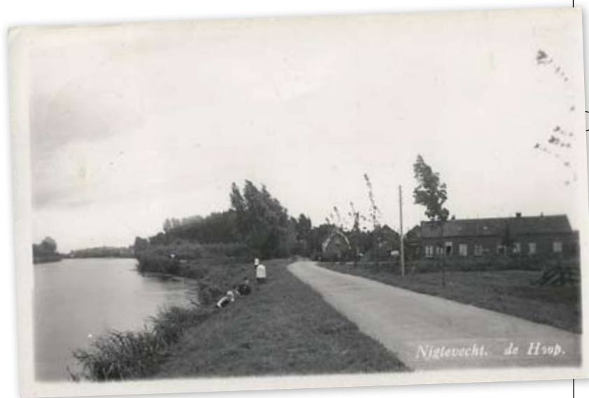
Rechts de Geitenkamp nog als weiland